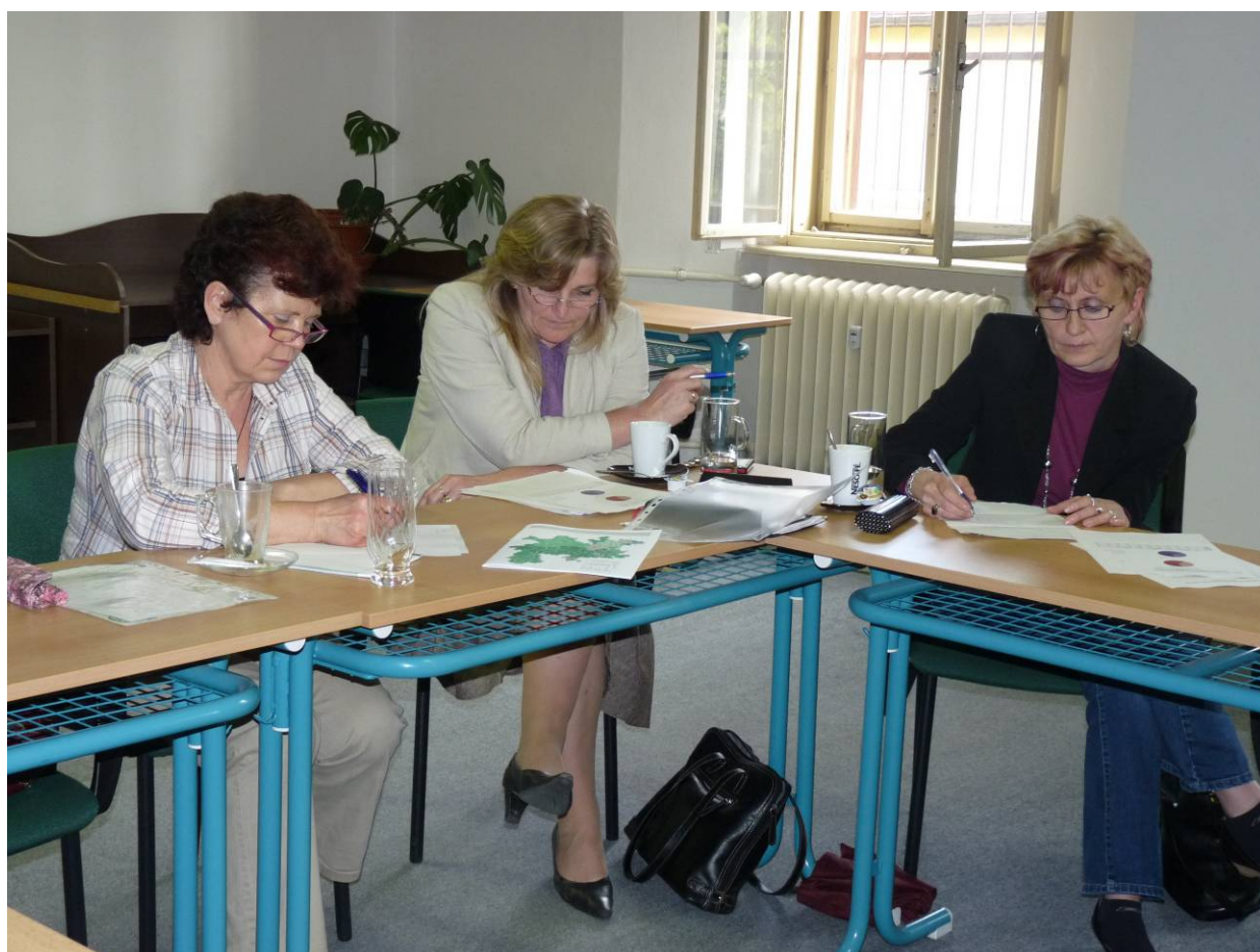
Foto ze setkání