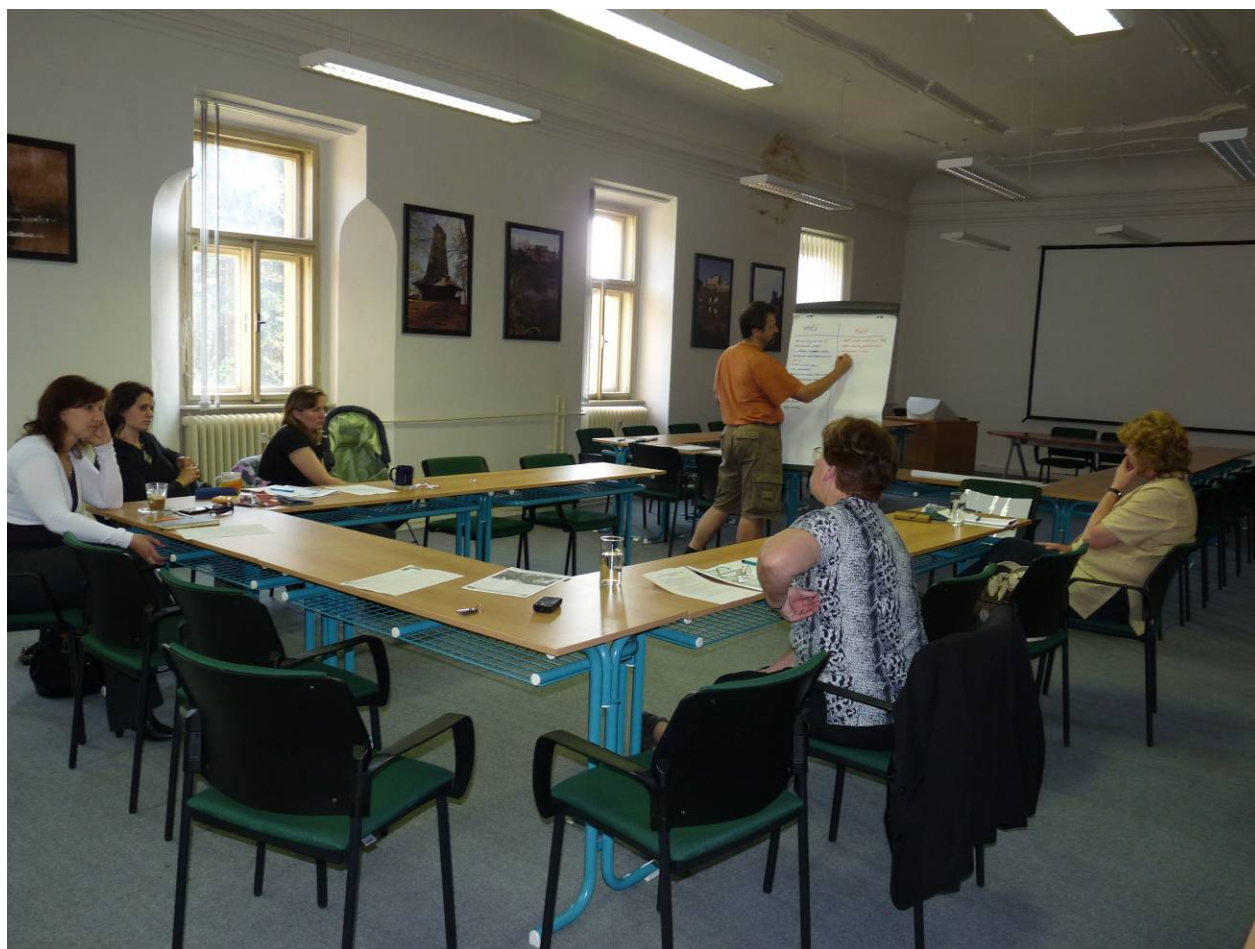
Foto ze setkání