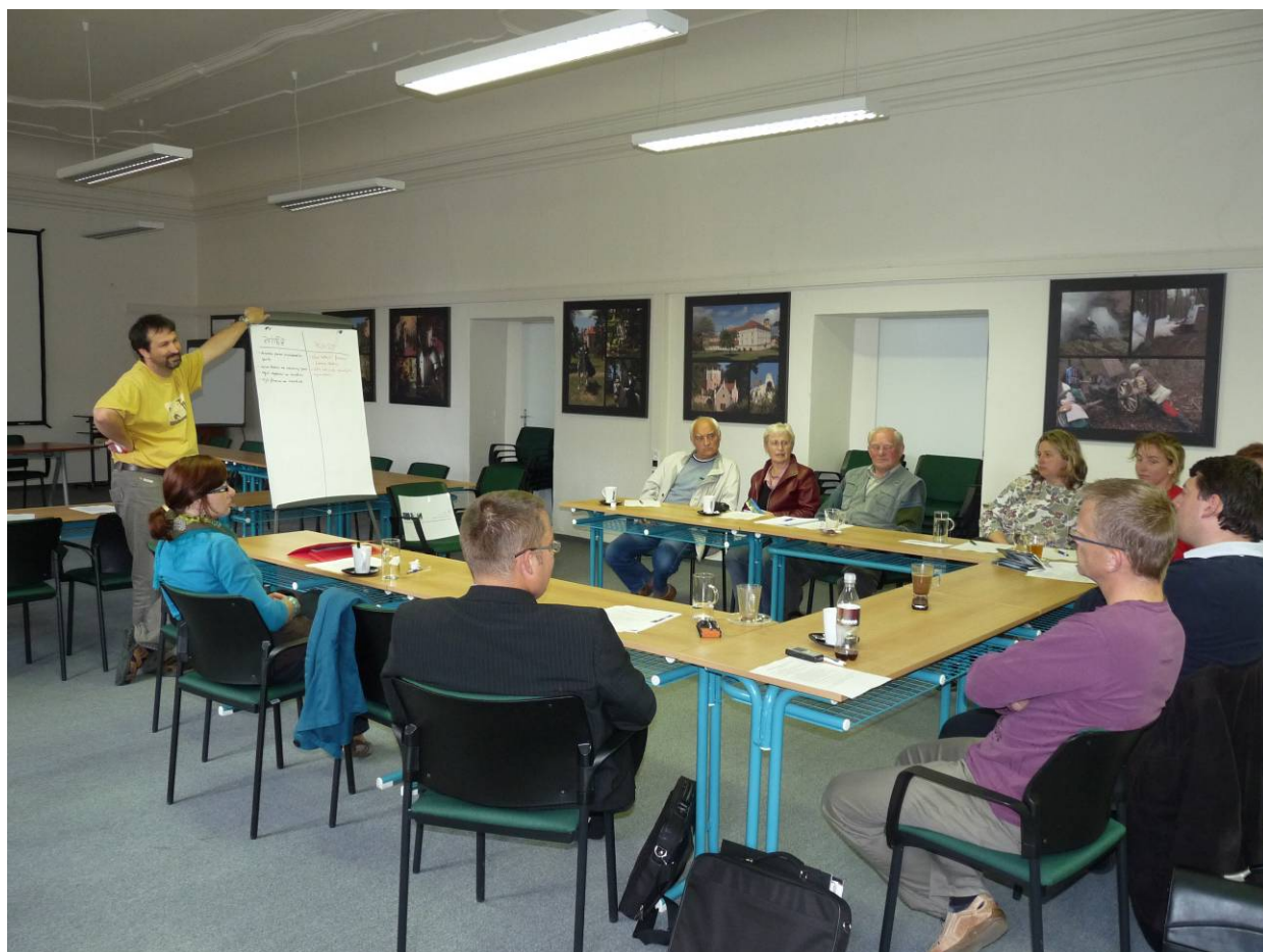
Foto ze setkání