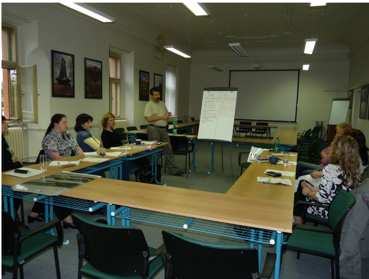
Foto ze setkání