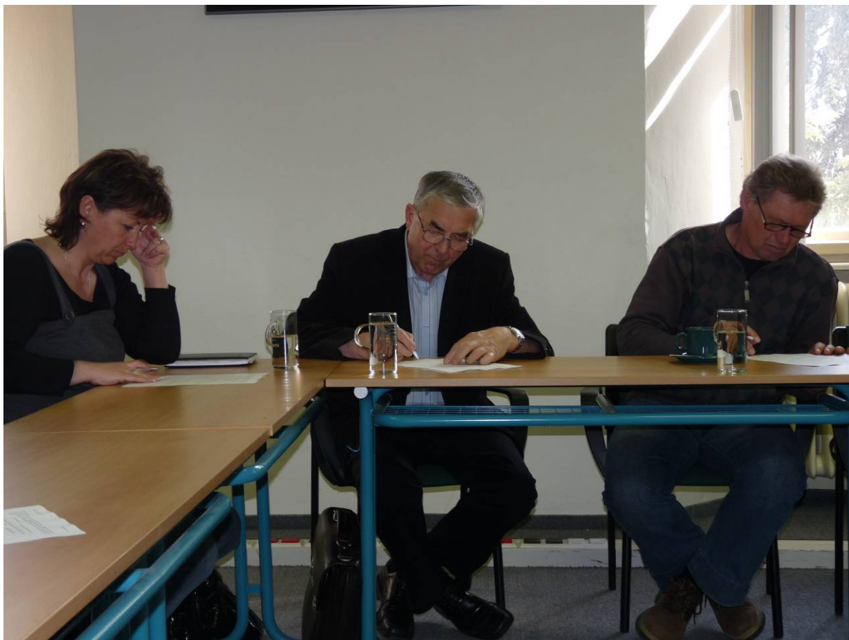
Foto ze setkání