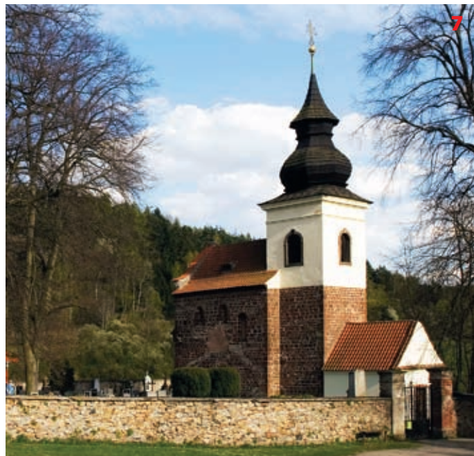
Rotunda sv. Václava v areálu hradu v Týnci nad Sázavou