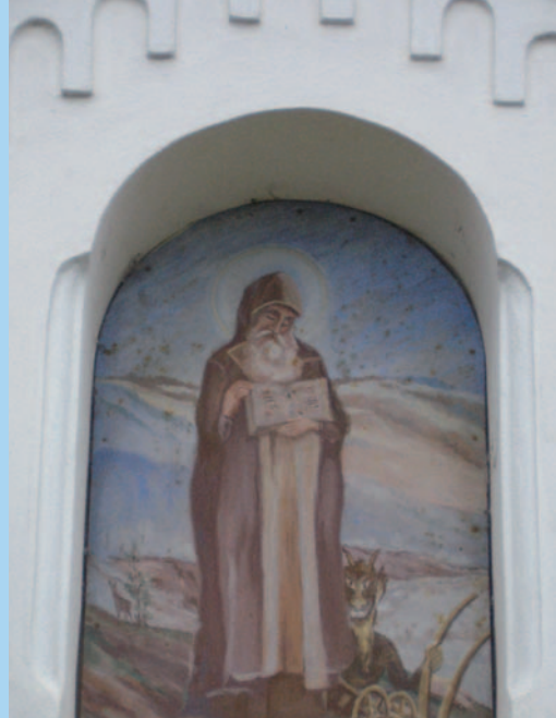
Svatý Prokop s čertem v kapličce na okraji Votočnice