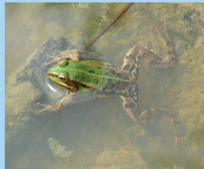
Jedním z prvních obyvatel nových tůní jsou skokani

S tím vším vás seznámí malá naučná stezka, kterou zde místní organizace ČSOP za finanční pomoci firmy RWE Transgas Net vybudovala. Přejeme příjemnou návštěvu plnou poznání a odpočinku.