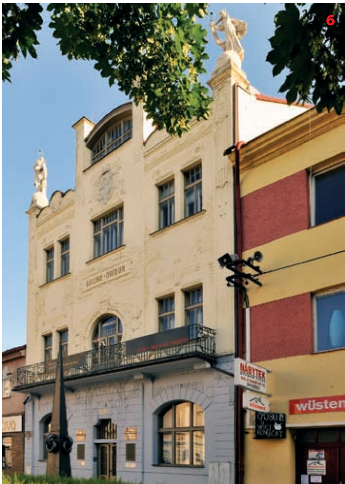
Bývalá záložna – dnes muzeum – v Benešově