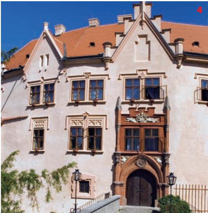
Zámek Vrchotovy Janovice