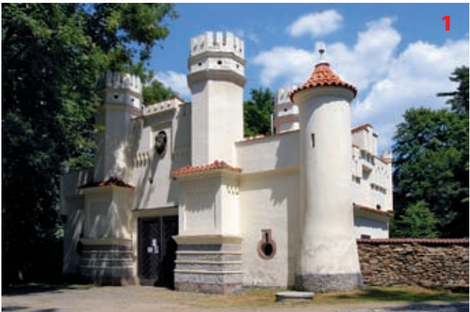
Znosimská brána zámekého parku ve Vlašimi