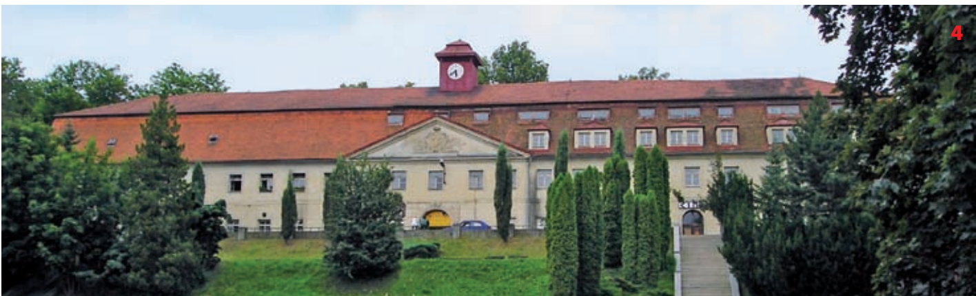
Bývalá továrna na kameninu v Týnci nad Sázavou