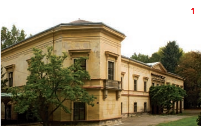
Zámek v Ratměřicích