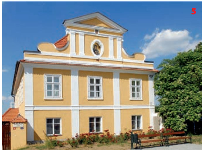
Děkanství ve Vlašimi