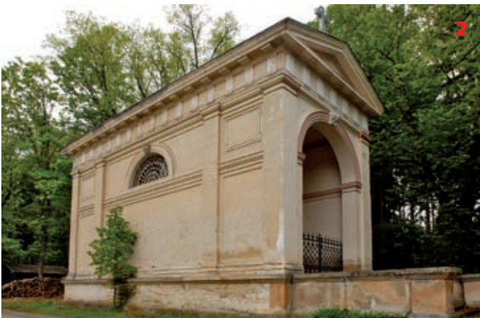
Loretánská kaple v Komorním Hrádku