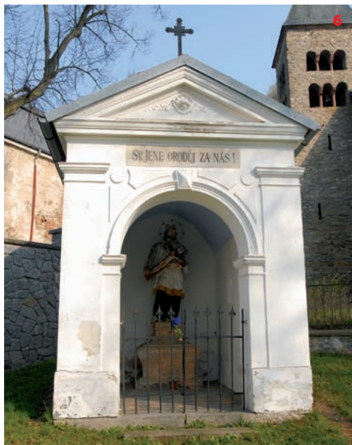
Kaplička sv. Jana Nepomuckého v Neustupově