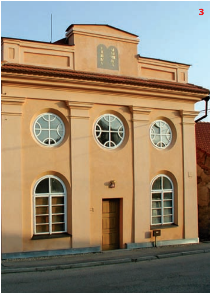
Synagoga v Divišově