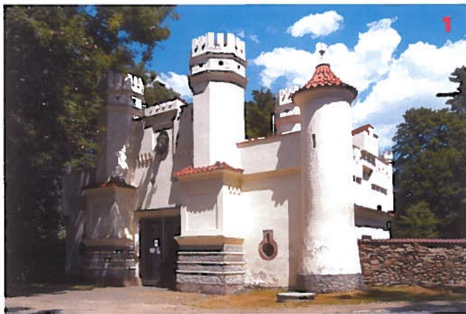
Znosimská brána zámekového parku ve Vlašimí