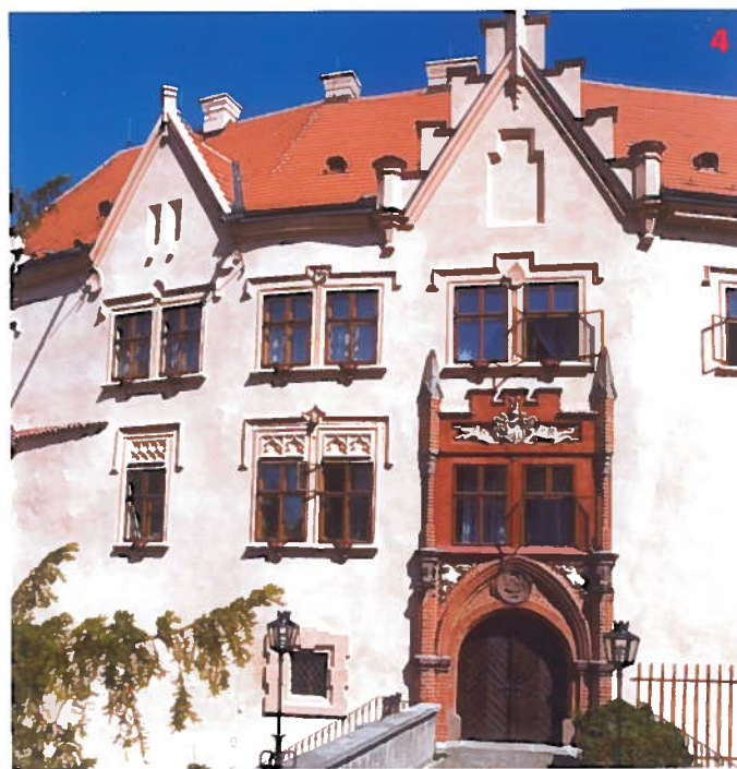
Zámek Vrchotovy Janovice