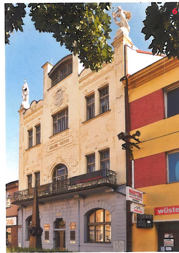
Bývalá záložna - dnes muzeum v Benešově