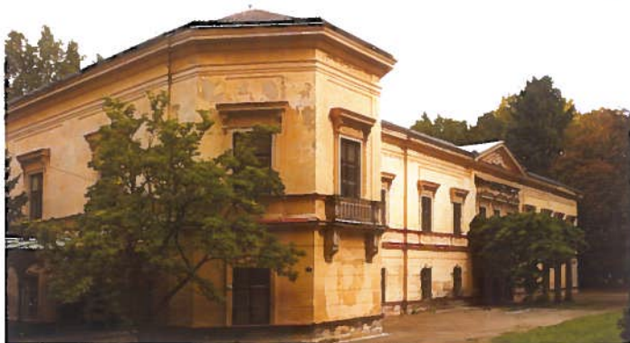
Zámek v Ratměřicích