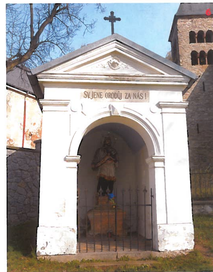
Kaplička sv. Jana Nepomuckého v Xestupově