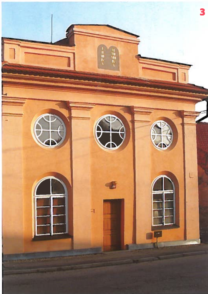
Synagoga v Divišově