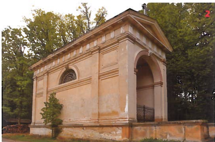
Loretánská kaple v Komorním Hrádku