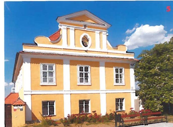
Děkanství ve Vlašimě