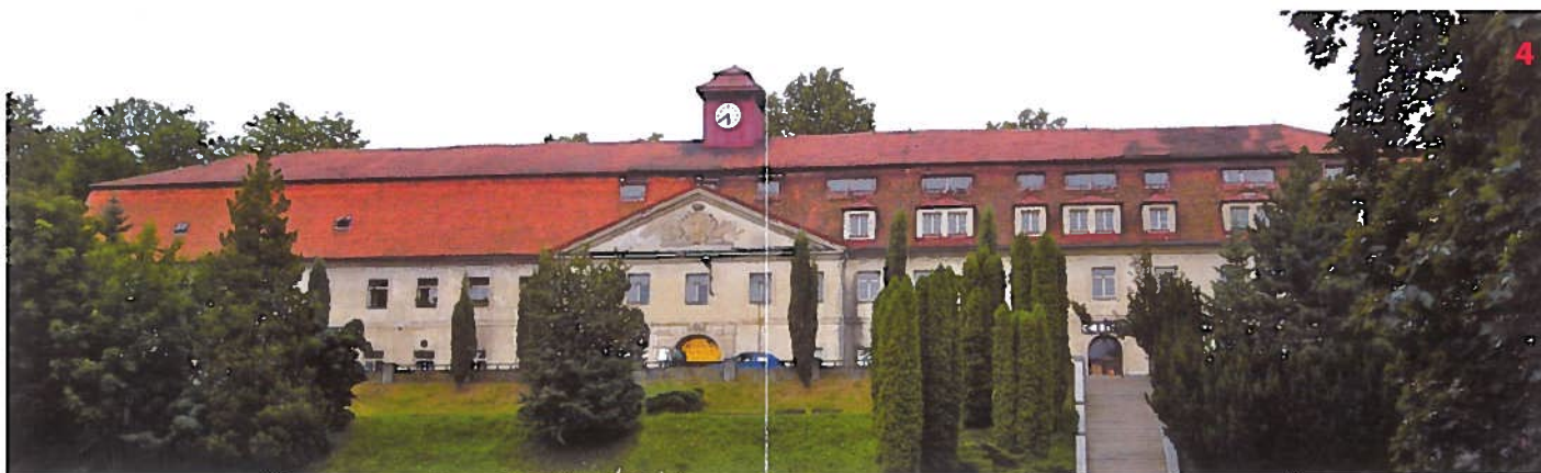
Bývalá továrna na kameninu v Týnci nad Sázavou