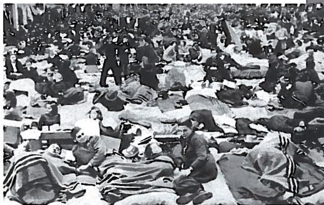
Příčiny na Rakovnicku