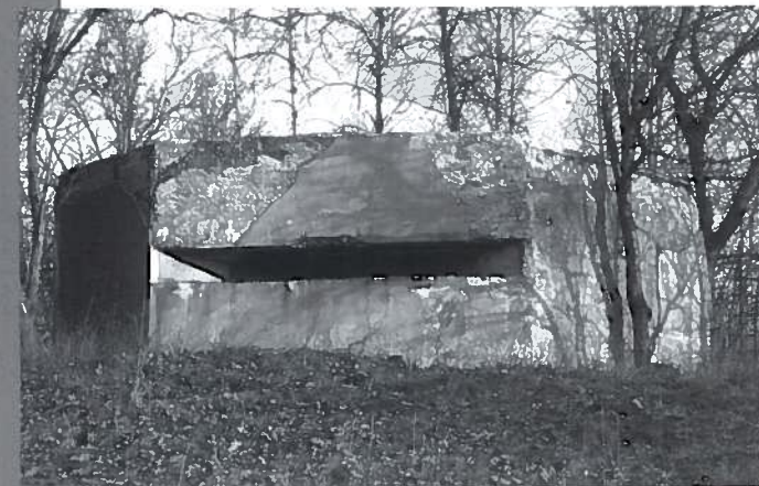
Příčiny u Posázaví