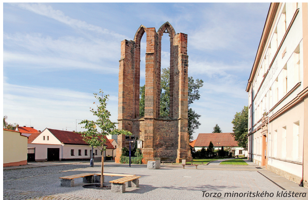
Torzo minoritského kláštera

královské jízdy na podzim 1419 napadl u Živohoště husity směřující na pouť do Prahy. V reakci na to husité vpadli do Benešova a zapálili zdejší kostel s farním dvorem. Při požáru vyhořel