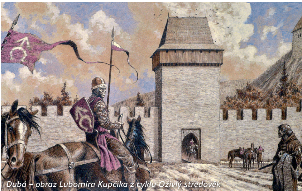
Dubá – obraz Lubomíra Kupčika z cyklu Oživlý středověk

V roce 1466 hrad rozbořilo vojsko krále Jiřího z Poděbrad a už nebyl obnoven. V roce 1648 se poprvé zmiňuje jako Stará Dubá. Hrad tvořil jeden celek s podhradním městečkem Odranec. Zřícenina unikátního sídlištního komplexu je volně přístupná.