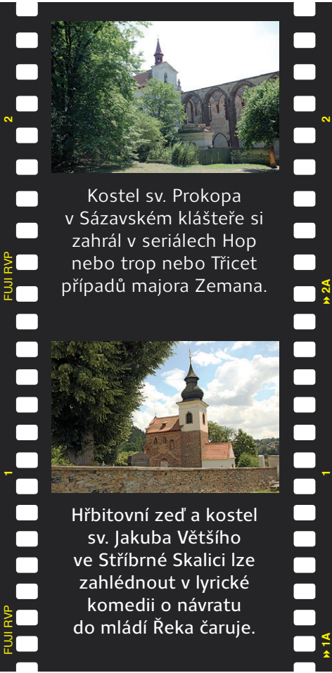
Kostel sv. Prokopa v Sázavském klášteře si zahrál v seriálech Hop nebo trop nebo Třicet případů majora Zemana.