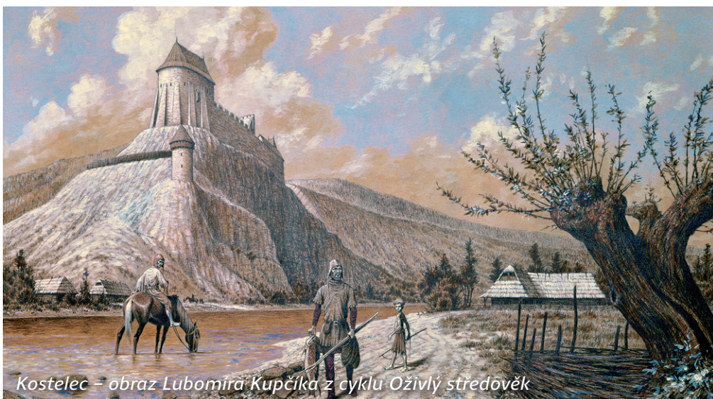
Kostelec – obraz Lubomíra Kupčíka z cyklu Oživlý středověk

Hrad, v minulosti nazývaný Kostelec, byl založen pravděpodobně za vlády Václava II. na konci 13. století, poprvé se ale zmiňuje až v roce 1342. V roce 1450 ho dobyla vojska vedená Zdeňkem Konopištským ze Šternberka, který se stal jeho majitelem a hrad přeměnil v jeden ze svých opěrných bodů. V roce 1467, v době poděbradských válek, královské vojsko hrad dobylo a zbořilo.