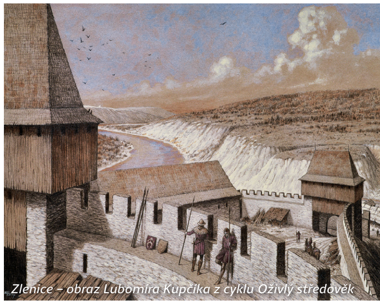
Zlenice – obraz Lubomíra Kupčíka z cyklu Oživlý středověk