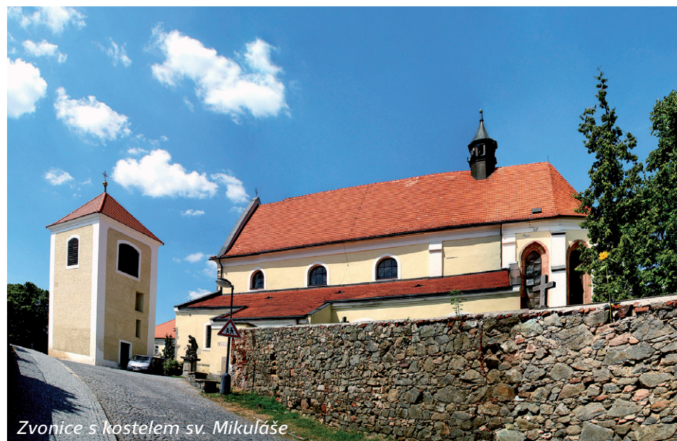
Zvonice s kostelem sv. Mikuláše