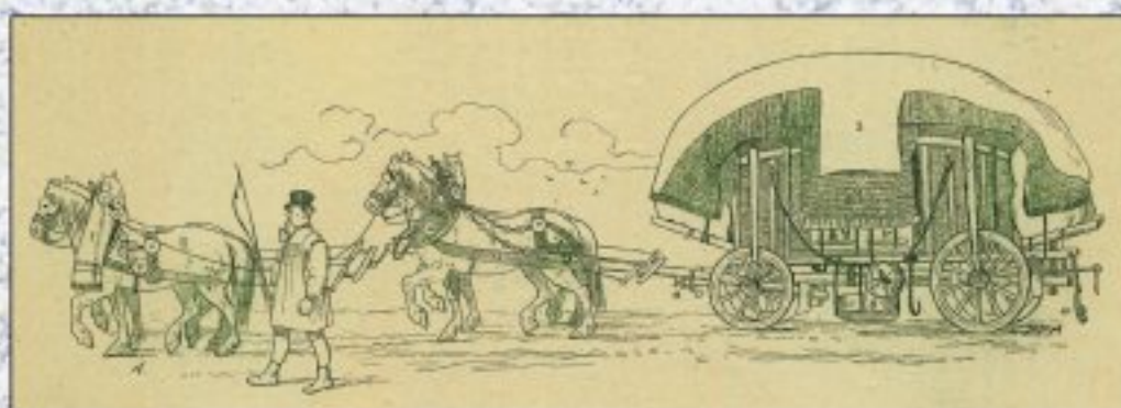
Vyobrazení kočárku z doby od Mikoláše (Česky lid, 1893)