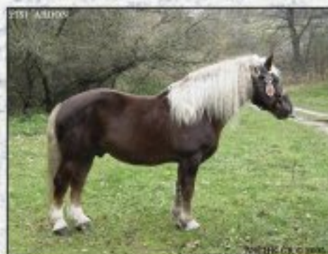
Českomoravský belgický kůň

v prvních stoletích našeho letopočtu v západní Evropě. Byl to velký kůň, který v kohoutku měl až 180 cm. Charakteristická byla jeho robustnost. Hlavu měl velkou, klabonosou, s menší mozkovinou. Z něj byla křížením vyšlechtěna plemena chladnokrevných koní – belgik, norik, percheron, suffolk, shire a další. V ČR jsou vedené 2 plemenné knihy chladnokrevných koní – slezského norika a českomoravského belgického koně. Ostatní plemena jsou registrována v zahraničních plemenných knihách. Pokud jste někdy slyšeli výraz štyrský valach, pak to je jeden z rázů norického koně.