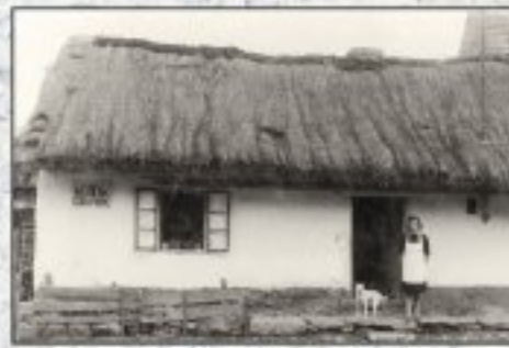
Obuvnictví Václav Mužík (čp. 8) s typickou doškovou střechou