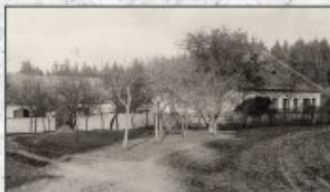
Haberská Mojzína (1901)

Se stavebnictvím souvisl i řemeslo, které (podle jednoho z možných výkladů) dalo Struhařovu jeho jméno – tzv. „ strouhání šindelů “. Tento typ střešní krytiny se však na počátku 20. století vyskytoval ve Struhařově spíše výjimečně. Dejme ještě slovo pamětníkům: „Tady se říkalo v lese „u starý šindelky“, to je někde na potoce, kde musela být voda, protože to řezali nějakou mašinou. Pak ta šindelka přešla k hájovně (čp. 88). Šindele tady řezali od lesů – Khevenhüller-Met-