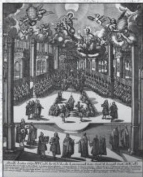
Sežehnění Jana Nepomuckého v Lateránské bazilice dne 19. 6. 1729

Dne 31.8.1683 byla vztyčena na Karlově mostě mučednická socha, dílo sochaře Jana Brokoffa, které mělo vliv na všechny pozdější sochy Svatého Jana Nepomuckého u cest, na mostech, před kostely nebo na mariánských a trojičních sloupech. Jan zde