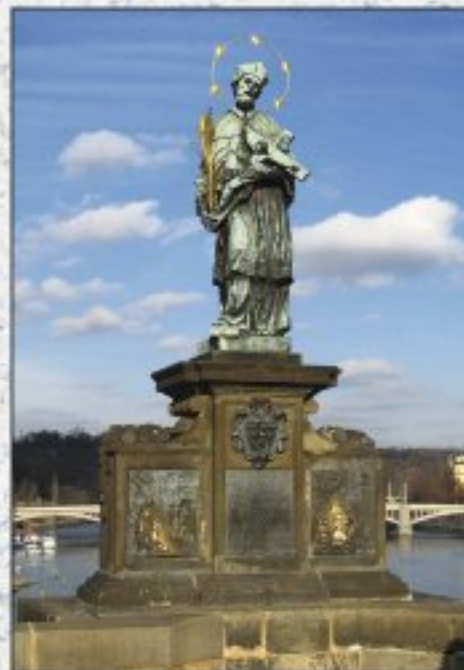
Vyobrazení svatého Jana Nepomuckého na Karlově mostě od J. Brokoffa

Bývá uváděn jako patron a ochránce: cti a proti vši zlé pomluvě a nářčení; mostů, plavců a tonoucích a proti povodním; kněžích, kazatelů a almužníků, chudých a nemocných; klidné smrti a proti moru; Prahy a proti Turkům; Habsburkům, Schwarzenbergům a Wunschwitzům; a také patron bezpečného putování a šťastného návratu.