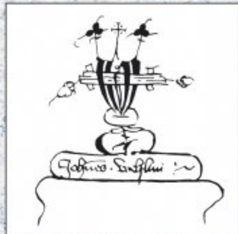
Notářský zprávní Jan Nepomucký

Jan se narodil v městečku Nepomuk (tehdy Pomuk) v západních Čechách někdy kolem roku 1345. Studia údajně absolvoval v cisterciáckém klášteře pod Zelenou Horou a na vyšší škole v Žatci. Později získal další vzdělání na právnické fakultě Karlovy univerzity a na univerzitě v italské Padově. V roce 1375 se připomíná ve funkci notáře arcibiskupské kanceláře.