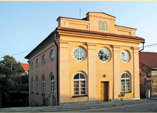
Synagoga v Divišově

Délka trasy: 38,6 km Kolo: trekové Obtížnost: středně náročná Občerstvení a zajímavá místa: Východím místem je obec Divišov (kostel sv. Bartoloměje, továrna JAWA, restaurace, nákupní středisko). Synagoga, ve které se nachází Muzeum života židovské obce, byla postavena v 1. polovině 19. století v pozdně klasicistním stylu s apsidou a rekonstruo- vána v roce 2004. Z Diviřova se vydáte po silnici č. 113 do Vlčkova (kaplička), dále po cyklotrase č. 0073 do Teplýšovic, odkud se okruhem přes Kozmice, Kácovu Lhotu,