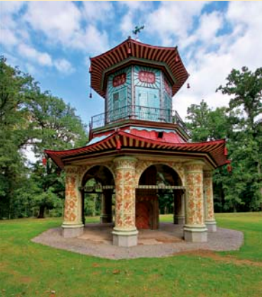
Čínský pavilon ve vlašském parku

Délka trasy: 51,6 km Kolo: trekové, horské Obtížnost: středně náročná Občerstvení a zajímavá místa: Tematická cyklotrasa vychází z kon- centrace zajímavých zámeckých parků v regionu, které většinou vznikaly v romantickém období druhé poloviny 18. století. Ideální začátek i konec trasy může být v vlašském zámku a parku, kde je v informačním centru možné uschovat kola a prohlédnout si romantické stavby i zámek. Z Vlaši- mi jedete směrem na jih přes Louňo- vice pod Blánikem až do Zvěstova. Zde můžete odbočit doleva na neza- čenou cestu do Odlohoovic, kde na- jedete příjemný zámecký park (kavár- na, toalety) a pokračujete dále po silnici do Ratměřic (zámecký park se sekvójci obrovských). Odtud se vydáte na sever přes Jankov (resta- urace) a Popovice na zámek Jemniště (zámeek, kavárna s občerstvením, zámecký park). Z Jemniště je možný návrat do Vlašimi nebo Benešova a to po vyznačených cyklotra- sách, popř. po silnici č. 112.