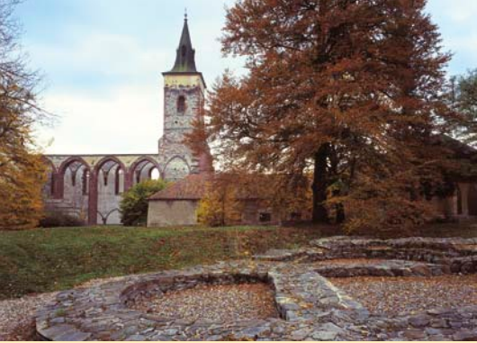
Klášter v Sázavě

Pak vyjedete směrem na jih po silnici přes Bělokozly do Čenčina a dále se napojíte na cyklotrasu č. 0073 a pokračujete kolem řeky Sázavy do Českého Šternberka (re- staurace, Parkhotel, pension Čtyřlístek, penzion U mlýna). Zde se tyčí nad řekou krás- ný gotický hrad přístupný veřejnosti (možnost prohlídky s průvodcem). Dále se vypra- vite po cyklotrase č. 0072 do Šternova, odtud jedete po silnici do Drahovic, kde se napojíte na cyklotrasu č. 0073 a pokračujete přes Třešnišnici do Ostředka (ubytování a restaurace). Dominantou Ostředka je barokní zámek, který není přístupný veřejnos- ti, ale můžete zde navštívit rodnou světničku spisovatele Svatopluka Čecha (je pří- stupná v sezóně o víkendech). Dále podjedete dálnici D1 a jedete po silnici přes Vod- slavy a Vestec (penzion U dvou čápů) do Chocerad. Chocerady jsou příjemným letoviskem, na návsi se nachází kostel Nanebevzetí Panny Marie, u řeky Sázavy Vávrův mlýn (restaurace, hotel Ostrovné, rekreační areál a kemp Lávká). Pak se vrátíte po cyk- lotrase č. 19 malebnou krajinou podél řeky Sázavy zpět do města Sázava.