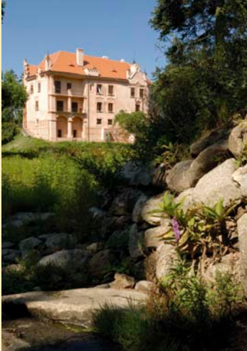
Zámek Vrchotovy Janovice

Délka trasy: 61,4 km Kolo: trekové, horské Obtížnost: středně náročná Občerstvení a zajímavá místa: Tematická cyklotrasa vás zavede na zám-ky Konopiště, Vrchotovy Janovice a na- vštívit můžete také park kolem zámku Lišno. Začátek i konec cyklovyletu si mů-žete zvolit – např. náměstí v Benešově (infocentrum, kavárny, restaurace) od- kud se vydáte směrem na Konopiště. Po návštěvě zámku budete pokračovat přes Bystřici (restaurace, vyhlášená točé- ná mzmřlina, ubytování) a Nesvačily (le- tiště) směrem na Vrchotovy Janovice, kde je další zámek spojený s baronkou Sidonií Nádhernou. Trasa dále pokračuje na jih, směrem na Olbramovice, po na- učné stezce – ta vede po upravených polních cestách a je značena směrovka- mi. Pokračovat budete až do Votic (infor- mační centrum, restaurace, ubytování, věrná kope jeruzalémského Božího hrobu, klášter, židovský hřbitov, stanice pro zraněné živočichy), potom dále přes Jankov (na- učná stezka Po stopách bitvy u Jankova, památník bitvy) a zpět směrem na Ouběnice a Lišno, kde si můžete prohlédnout zámecký park. Z Lišna se vydáte zpátky do Bene-šova, kde výlet končí.