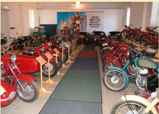
Motocykly a technické muzeum v Netvořicích