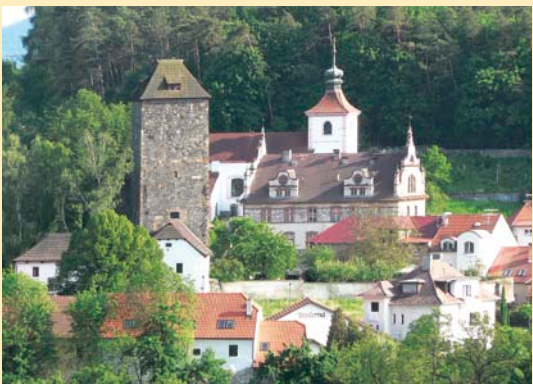
Týnec nad Sázavou

Délka trasy: 35,2 km Kolo: trekové, horské Obtížnost: náročná