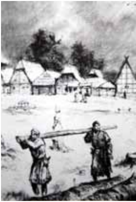
Možný vzhled náměstí městečka zvaného Sekanka, malíř Gustav Krum.