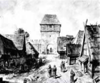
Kresby akademického malíře Gustava Kruma ukazují vzhled českých měst v době jejich zakládání po polovině 13. st.

V blízkosti Jílového u Prahy prochází i nejkrásnější železnice u nás – slavný Posázavský pacifik.