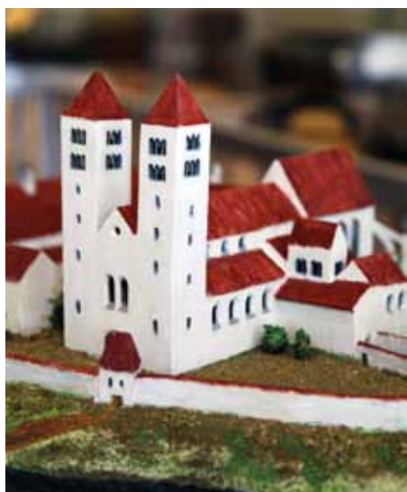
Model kláštera › na Ostrově Regionálního muzea v Jílovém u Prahy

Řád svatého Benedikta (lat. Ordo Sancti Benedicti, OSB) je nejstarší existující mnišský řád západního křesťanství. Řídí se řeholí svatého Benedikta z Nursie z počátku 6. století, která byla sepsána pro mnišské společenství v klášteře na Monte Casinu. Mottem řádu se stalo heslo „ Ora et labora “ – česky „ Modli se a pracuj “.