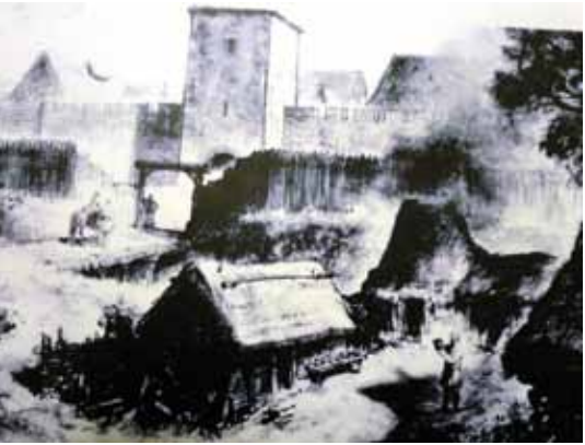
Tak tehdy mohlo vypadat i osídlení městečka zvaného Sekanka, malíř Gustav Krum.