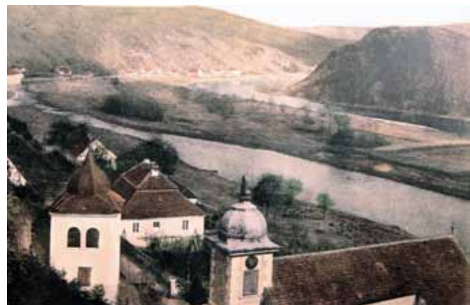
◀ Pohled přes kostel sv. Kiliána na plochu, kde stával klášter na Ostrově, před vzedmutím hladiny Vranské přehrady na přelomu 19. a 20. století.

Soutok Vltavy a Sá- › zavy u Davle, nad kterým na ostrohu nad řekami stávalo středověké městečko nyní zvané Sekanka. Své pojmenování městečko získalo po- dle dochované stezky vytesané ve skalním masivu klesajícím k řece v místech benediktinského kláštera sv. Jana Křtitele. Tento klášter je třetím nejstarším řeholním domem v Čechách.