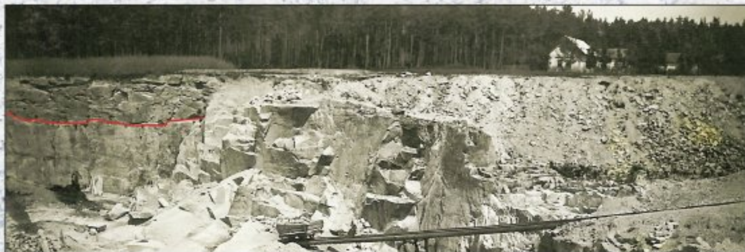
Na staré fotografii kamín na Hore je patrné rozpadání roztříštěnou a prvnou žulou (na levé straně fotografie), hore je zvětrávání červenou čarou. Je zde patrné rozvolnění skály podle systému puklin. Na pravé straně fotografie pak vidíme, co se stane s takto rozvolněným blátem poté, co se mechanicky rozpadl. Bloky, které byly zcela rozpadlé, ale byly dříve v celistvosti bloky pohybovaly se při uvolnění z masivu ve velmi krátké době rozpadly na písek, v němž „plavou“ malé zvětrávané kamínky. „Kamenné písky“ se je toto rozpadlé skály „písek“ málo odlišuje. Vzhledem k tomu se říká „roztříštěný“ nebo „roztříštěný“ kamín, klouběji je tvrdší a lepší jakost“ (z mukařovské kroniky).