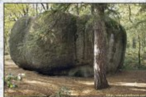
Tento balvan se nazývá „Fůra sena“ a nachází se na kopci nedaleko Přibor. Na tomto místě je hřbitov skalků, z nichž voda vytváří žlobky přes okraj kamene. Výška balvanu je 4 m.

Dalšími zvětrávacími tvary jsou mrazové sruby. Jsou to skalní stupně ve svahu nebo skalní hradby na hřebtech omezené svislými stěnami. Náznaky skalních srubů můžeme vidět podél silnice z Jevan do Stříbrné Skalce.