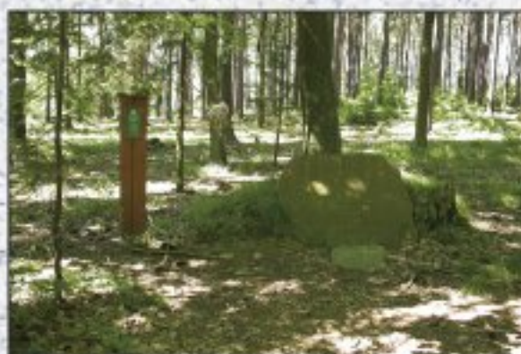
Whitice – Rataje

Kníže proslul jako mecenáš vědy a umění a jeho zásluhy mu vynesly přídomek Dobrotivý. Jeho zásluhou mohly vzniknout přírodní rezervace Šerák