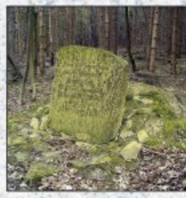
Kuželov. Pamětník se nachází jižně od Kuželova. Okres Mladá Boleslav, panství Kuželov.