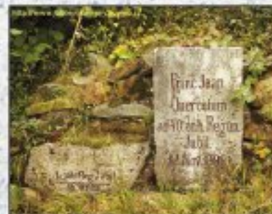
Rádkov. Pamětník se nachází na hranici okresů Břeclav a Vyškov, v části Řešeni, náležející východu Páveč. Okres Břeclav, panství Židčice.