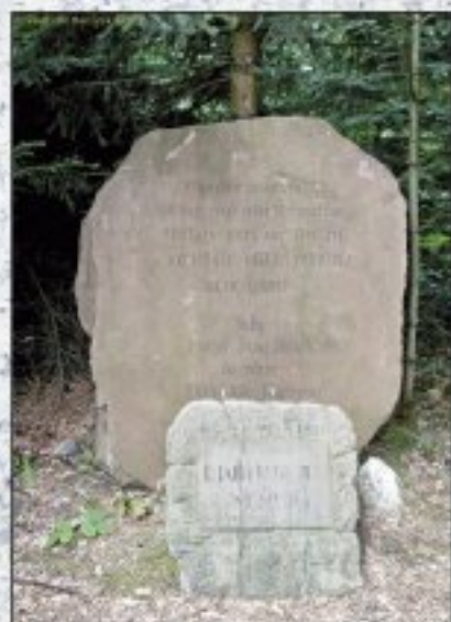
Makolusky, Mladá Boleslav, okraj Rataje nad Sázavou. Makolusky lidem je v hojnosti a Mladá Boleslavská správa od dle Mladá Boleslav – Chotěboř na odbočku do Sázavy.

Informace o dalších kamenech naleznete na: http://www.jubilejnikameny.euweb.cz/index.html