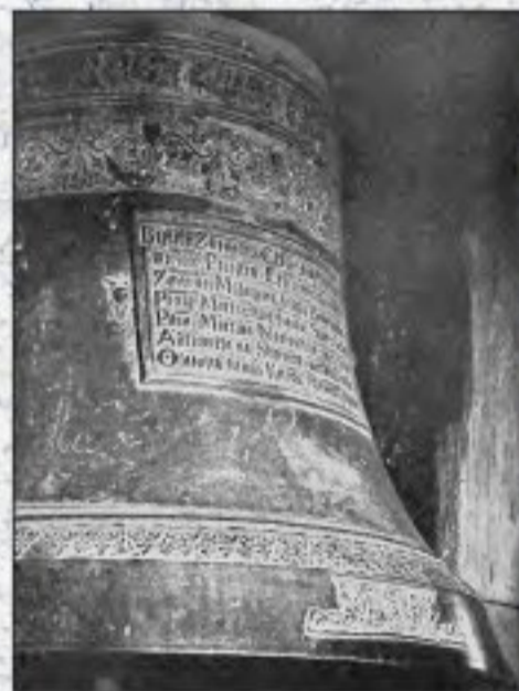
Zvon mukařovského kostela věnovaný Šmířickým z poloviny 16. století

LETA PANIE 1718 TENTO ZWON PO VKRADENI PRE-DESSLEHO NAKLADEM ZADUSSI ZGEDNAN A ZA- WIESSEN KE CTI A CHWALE BOZY A NEISWIETESSI RODICZKY BOZY