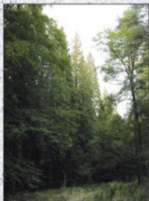
Stromová řada lesních tůjí

Zelená cesta tvoří přímku směřující od tohoto místa ke kostelu v Mukařově. Ne sice zcela přesně, ale v dobách prvního mapování se zakreslovalo pouze podle vizuálních dojmů pověřeného důstojníka, který projížděl krajinou na koni a vše měřil jen „přes