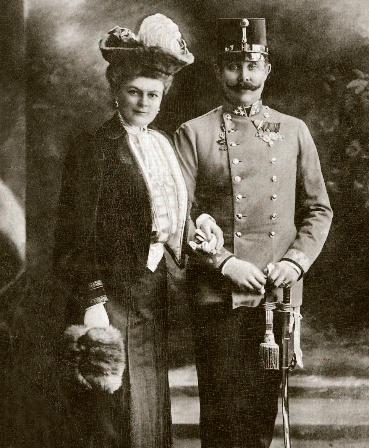
František Ferdinand d'Este