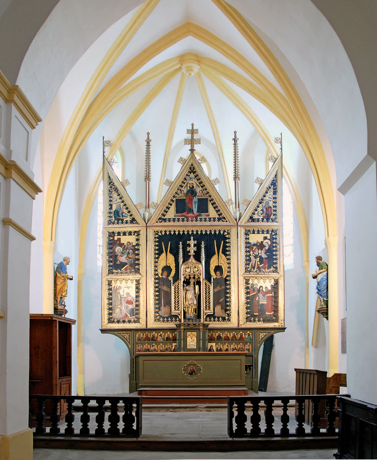
Jílové u Prahy