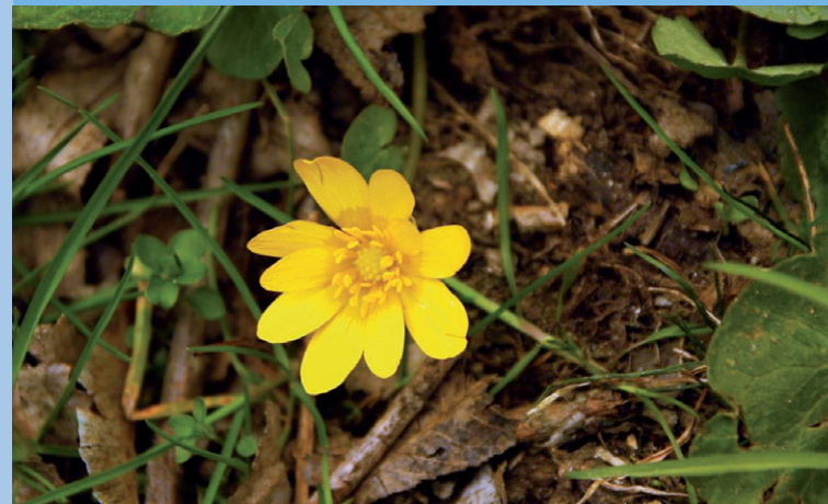
Grafická úprava a tisk: Pavel Fuksa – GraTypoPrint Vydala společnost Posázaví o.p.s. v roce 2020 v nákladu 5 000 ks NEPRODEJNÉ